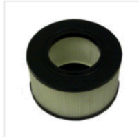
Nilfisk ULPA Cartridge #01737631 $294.20