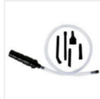
Nilfisk Micro Tool Kit #01702300 $41.10