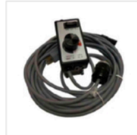
Nilfisk GM80 Variable Speed Control M90029 $506.08

हालांकि यह उदाहरण महंगा है, आप स्थानीय रूप से ऐसा ही समान काम करने वाला उत्पाद पा सकते हैं। अपना चेहरा ढंकना और दस्ताने पहनना सुनिश्चित करें! नली की नोक पर एक कपड़ा लपेटने से खजाने को निर्वात में खींचने से रोका जा सकता है!