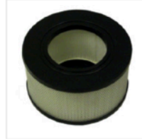
Nilfisk Hepa Cartridge #01727631 $243.18