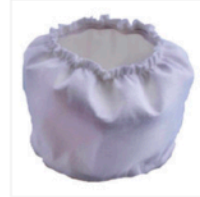
Nilfisk Micro Filter #11730410 $43.10