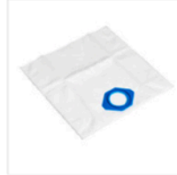
Nilfisk Vacuum Bags #107418525 $25.75