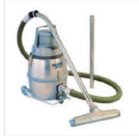
Nilfisk GM80 Museum Model HEPA Vacuum $1,572.40

सकते हैं; खजाने पर सीधे वैक्यूम का प्रयोग न करें। यदि आप एक अच्छी तरह से वित्त पोषित संग्रहालय या पुस्तकालय में काम करते हैं, तो आप विशेष वैक्यूम क्लीनर खरीद सकते हैं जिसमें एक फिल्टर होता है जो आपके खजाने से हटाए जा रहे दृश्य मोल्ड को इकट्ठा करने के लिए होता है ताकि मोल्ड बीजाणु आपके फेफड़ों में प्रवेश न कर सकें और आपको बीमार न कर सकें।